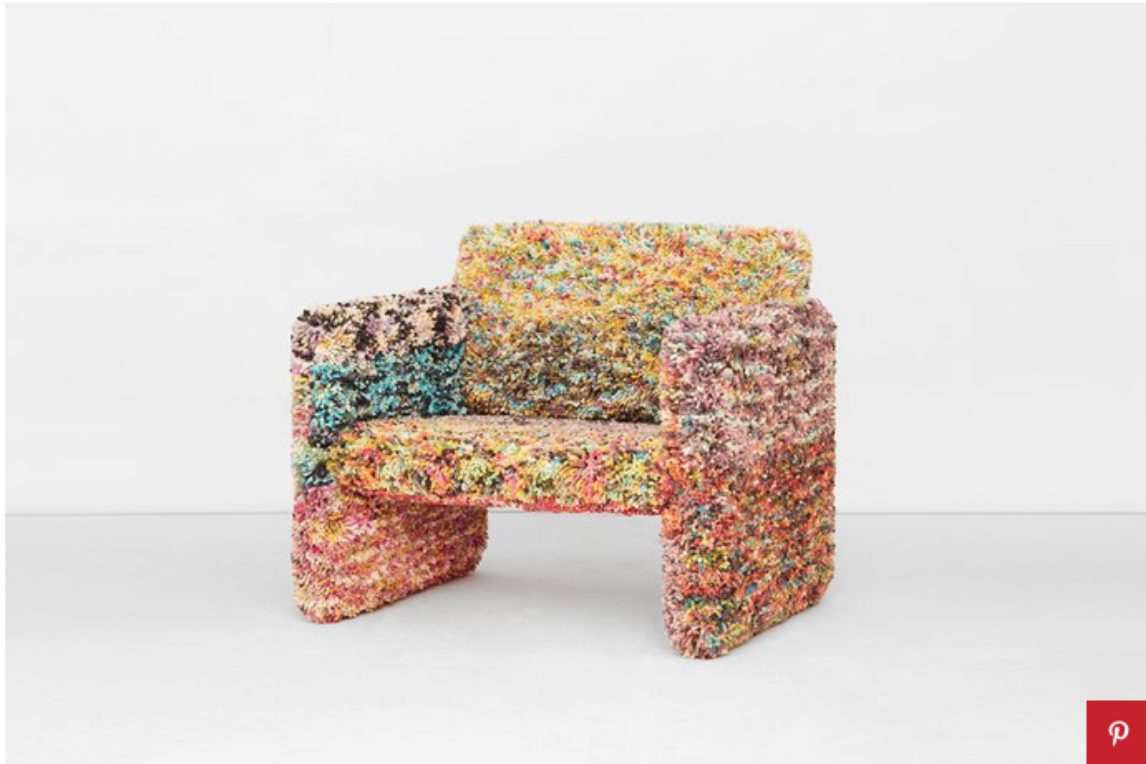
Max Lamb, tufted pillow armchair