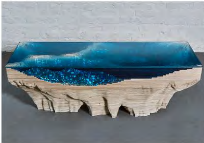
Кристоф Дюфи. Кофейный столик Abyss. Цветное стекло, дерево, синтетическая смола.