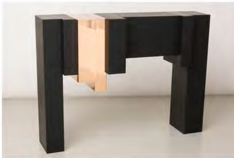
Studio Nucleo. Консоль Bronze Age, 2015. Единственный экземпляр. Полированная бронза. ©Studio Nucleo. Courtesy of Ammann Gallery.