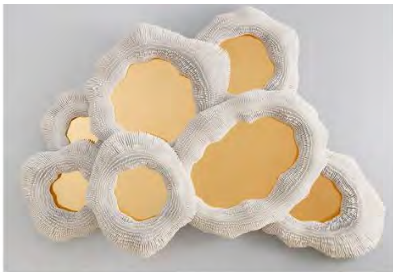
Пия Мария Федер. Sea Anemone 10, 2017. Зеркала, лак, 27 000 деревянных тростинок.

Парижская галерея покажет восемь новых работ, созданных в 2017 году. Среди них – вещи по дизайну французско-китайского дуэта Studio MVW: декоративные консоли и кофейный столик из красной меди и розового нефрита (тираж – 8 экземпляров + 4 авторских прототипа); биоморфный светильник-уникат израильтянки Аялы Серфати из сотни стеклянных трубок и полимерной мембраны и скульптурная консоль Жильдаса Бертело, канадского мастера-краснодеревщика, который придаёт дереву дигитальные футуристичные формы.