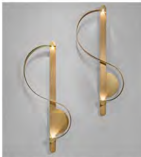
Шарль Калпакян. Светильники Cle de Sol, 2017. Позолоченная бронза. Тираж: 20 экземпляров + 4 прототипа.