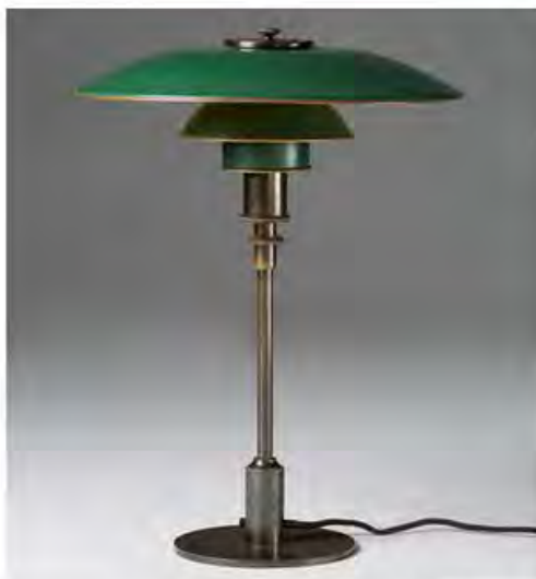
Поуль Хеннингсен. Настольная лампа PH 4/3, Louis Poulsen, 1926-27. Лакированный медный рассеиватель, бронзовое основание.