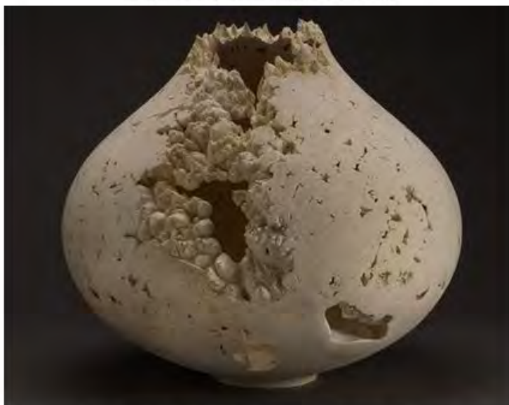
Элеанор Лэйклин. Raised Vessel I C17, 2017. ©Jeremy Johns. Courtesy of Sarah Myerscough Gallery.