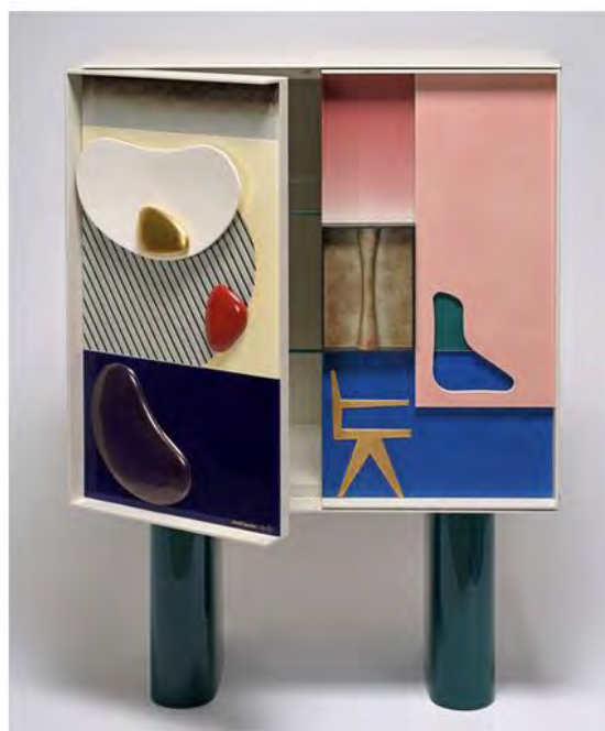
Doshi Levien. Декоративный комод, Sèvres, 2017. Тираж: 8 экземпляров.