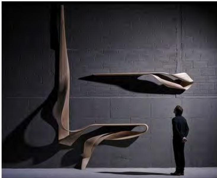
Джозеф Уолш. Серия Enignum, 2016. Оливковый ясень.