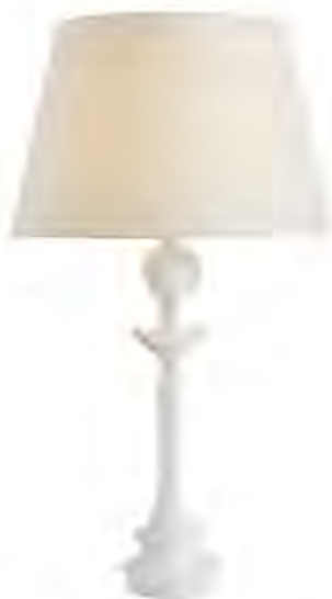
Альберто Джакометти, Жан-Мишель Франк. Настольная лампа Tête de femme, около 1935. Гипс. Francis Amiand. Courtesy of Galerie Alexandre Biaggi.