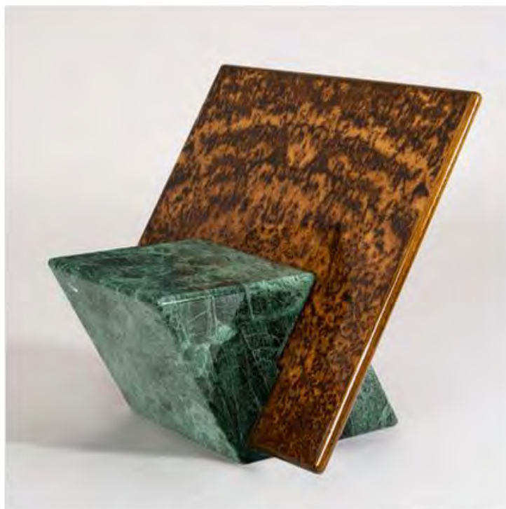
Brooksbank & Collins. Кресло The Fonteyn Chair, 2017. Тираж: 8 экземпляров + 2 прототипа.

Центром притяжения на стенде лондонской FUMI Gallery станет монументальная работа дизайн-дуэта Brooksbank & Collins: кресло-скульптура Fonteyn Chair в виде двух геометрических объёмов, куба из зелёного гватемальского мрамора и врезанной в его толщину пластины из корня дуба. Экстравагантное сочетание должно символизировать творческий союз прима лондонского Королевского балета Марго Фонтейн и её партнёра Рудольфа Нуриева. Тираж – 8 экземпляров + 2 прототипа.