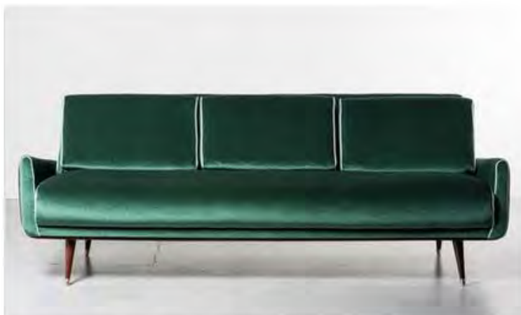
Хорхе Зальзулин. Sofa model 801, L'Atelier, 1960. Древесина жакаранды.

Миланская галерея Nilufar покажет произведения эксцентричной британки Бетан Лоры Вуд: подковообразные светильники Trellis, вдохновлённые женской бижутерией, и обеденный стол Melon из белого мрамора с инкрустацией цветным ониксом. Нежный рисунок столешницы, исполненный мастерами итальянской фабрики Budri, воспроизводит структуру замороженной дыни. Обе работы 2017 года, тираж – 10 экземпляров.