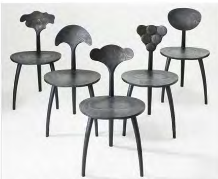
Джон Мэйкрис. Trine Chairs, Organic Collection , 2017.

Галерея представит свои знаковые вещи: закрученные невероятными спиралями объекты Джозефа Уолша из серии Epidium (2016) и вариации Кристофа Дюфи на тему его знаменитого стола Abyss со стеклянной столешницей, изображающей морскую бездну. Из новых опусов – деревянные сосуды британской художницы Элеанор Лэйклин, вырезанные из древесных корней и напльвов. “Меня вдохновляет дерево как живая, дышащая субстанция, – объясняет она свой интерес к природному материалу, – и восхищает хаотичное торжество органики”.