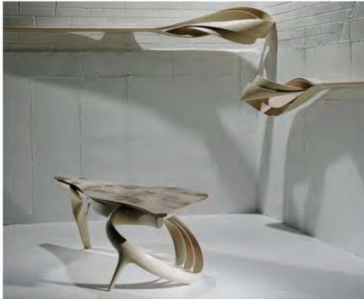
Джозеф Уолш. Серия Enigma, 2016. Оливковый ясень.