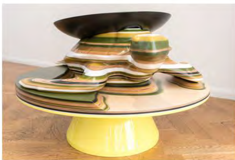
Хелла Йонгерюс. Кофейный столик Turtle