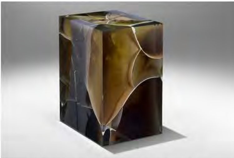
Studio Nucleo. Stone Fossil Obsidian, 2017. Тираж: 8 экземпляров + 2 прототипа. Эпоксидная смола. ©Studio Nucleo. Courtesy of Ammann Gallery.