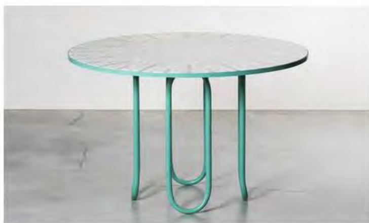
Бетан Лора Вуд. Обеденный стол Melon, 2017. Лимитированная серия.