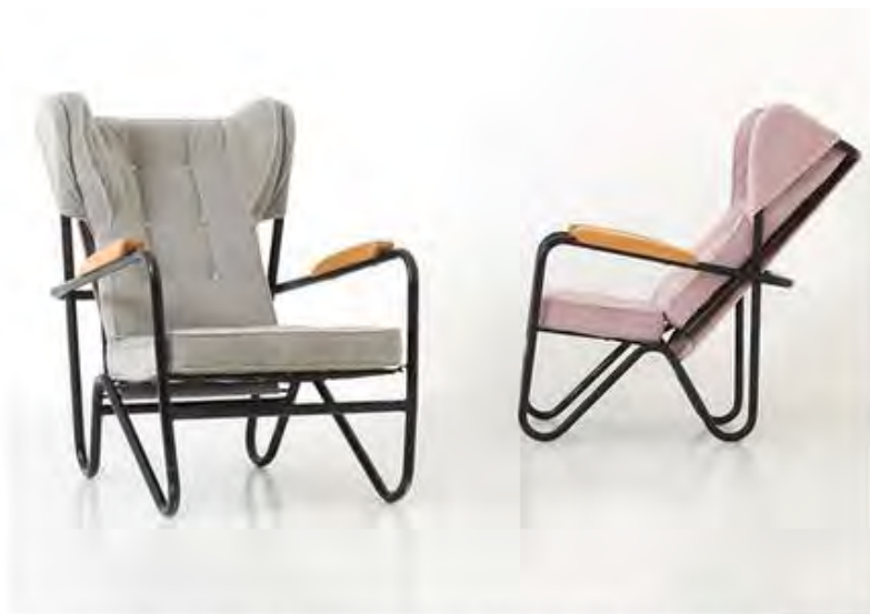
Пьер Гариш. Пара кресел Prefacto Monsieur and Madame Armchairs, Airbone, 1950-е.