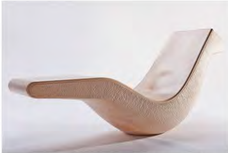
Сатиендра Пакхале. Лежанка Kubi, 2009. Тираж 7 экземпляров + 2 прототипа. Древесина липы. ©Satyendra Pakhale. Courtesy of Ammann Gallery.