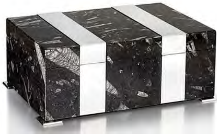
Шкатулка ар-деко, около 1925, Cartier. Окаменелая порода, серебро.