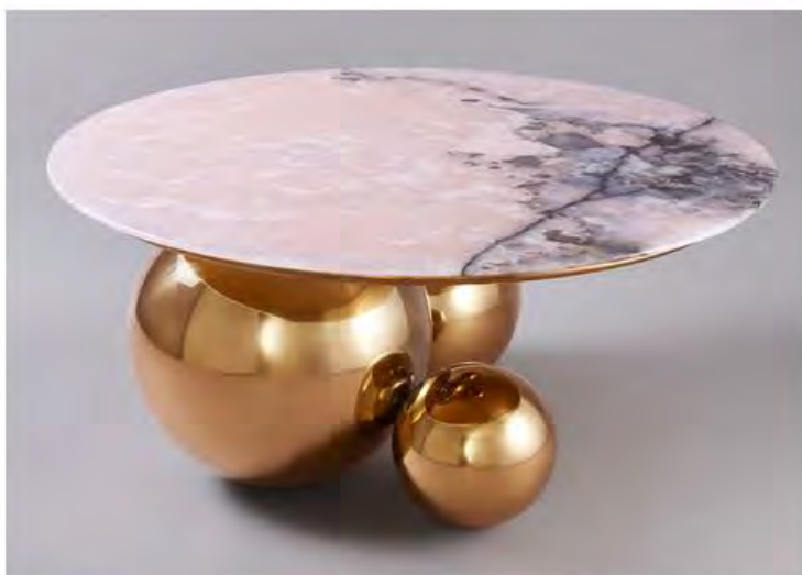
Studio MVW. Кофейный столик JinShi Pink Jade. Тираж: 8 экземпляров + 4 прототипа.