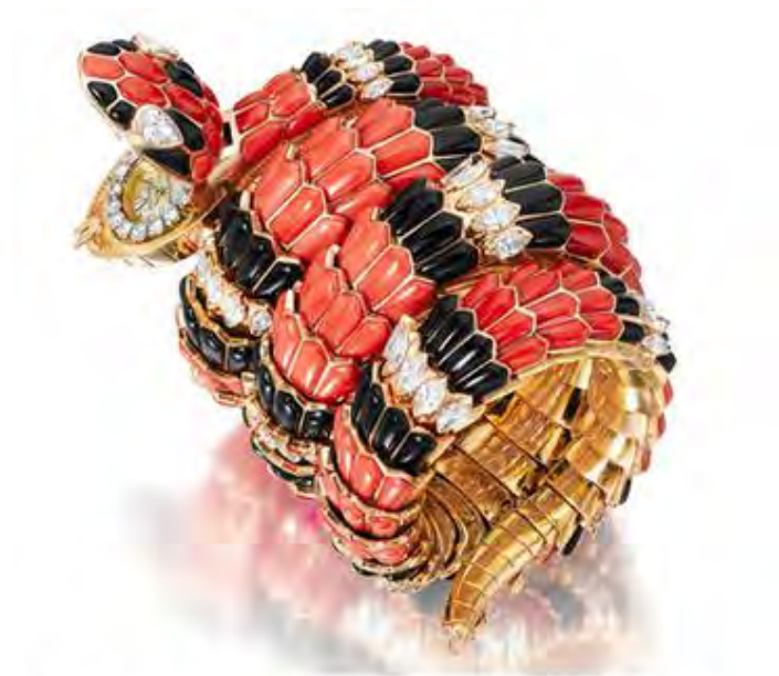
Браслет-часы Serpenti, около 1960, Bulgari.