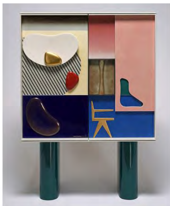
Doshi Levien. Декоративный комод, Sèvres, 2017. Тираж: 8 экземпляров.

Основанная в 1740 году Севрская мануфактура (Sèvres) демонстрирует на своём стенде примеры творческих коллабораций с современными дизайнерами. Абсолютная удача – декоративный шкафчик с рельефными створками, придуманный для знаменитой фабрики лондонской студией Doshi Levien. Он продолжает традиции создания декоративной мебели из фарфора, а своей эстетикой отсылает к искусству модернизма XX века: абстракциям Александра Колдера и архитектуре Ле Корбюзье. Предмет издан тиражом 8 экземпляров, каждый из которых отмечен авторской подписью.