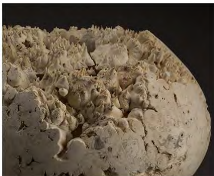
Элеанор Лэйклин. Voided Vessel XII C17 , 2017.