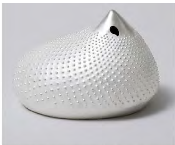
Юки Фердинандсен. Декоративный сосуд Drop II, 2016. Единственный экземпляр. Серебро.