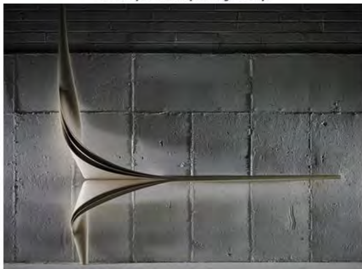
Джозеф Уолш. Серия Enignum, 2016. Оливковый ясень.