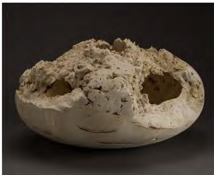
Элеанор Лэйклин. Voided Vessel XI C17 , 2017. © Jeremy Johns. Courtesy of Sarah Myerscough Gallery.