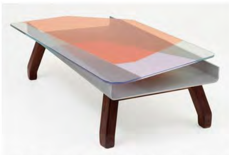
Хелла Йонгериус. Кофейный столик Dragonfly