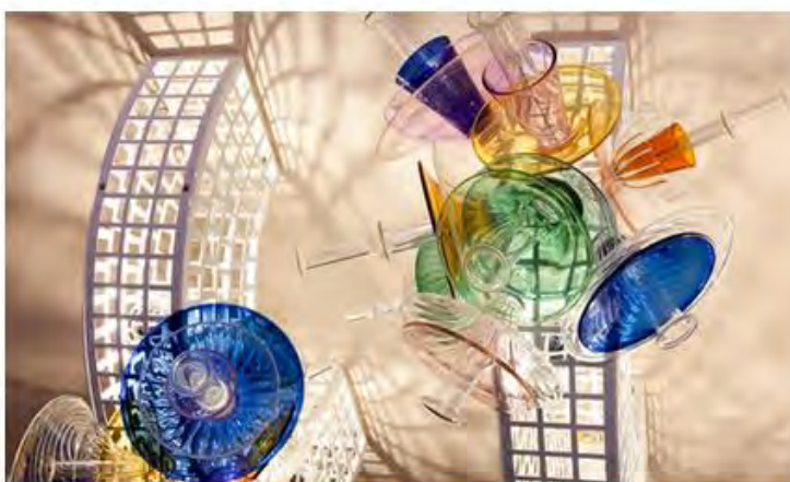
Бетан Лора Вуд. Светильник Trellis, 2017. Лимитированная серия. Стальной каркас, стекло.