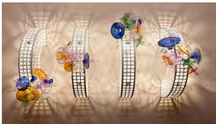
Бетан Лора Вуд. Светильник Trellis, 2017. Лимитированная серия. Стальной каркас, стекло.