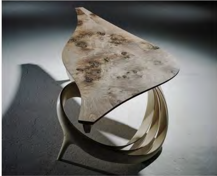
Джозеф Уолш. Рабочий стол Enignum IV, 2016. Оливковый ясень.