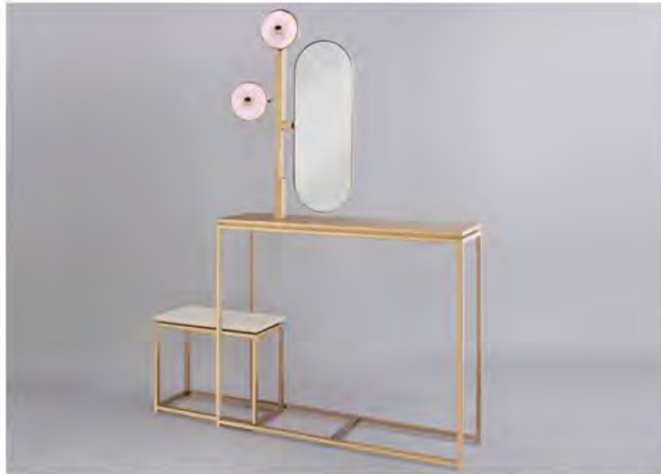
Studio MVW. Консоль JinShi Pink Jade. Медь, розовый нефрит, сталь, LED-подсветка. Тираж: 8 экземпляров + 4 прототипа.