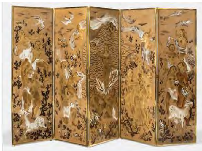
Макс Ингран. Ширма La Naissance de Venus, около 1933. Гравировка, роспись по стеклу, серебрение.

Свои шедевры представят галереи, специализирующиеся на эпохе ар-деко и дизайне модернизма. Вещи музейного уровня покажет парижская галерея Viaggi, в том числе редчайший светильник 1930-х годов, созданный дизайнером Жан-Мишелем Франком в соавторстве с Альберто Джакометти. Галерея Jacques Lacoste выставит роскошную ширму Макса Инграна, Galerie Le Beau – мебель бразильского модерниста Хорхе Зальзупина, нью-йоркская галерея Siegelson – кольцо из сапфиров, изумрудов и рубинов дизайнера Сюзанн Бельперрон и винтажный браслет с часами от Bulgari.