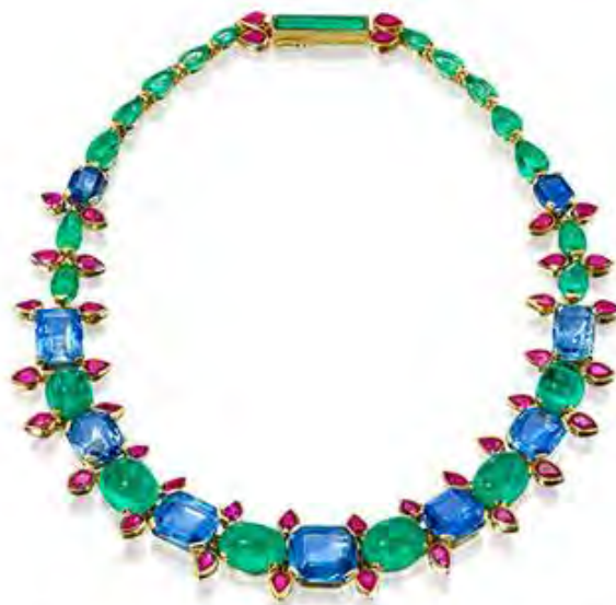
Колье Hindu, дизайнер Сюзанн Бельперрон, около 1948.