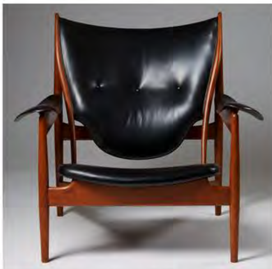
Финн Юль. Кресло Armchair Chieftain, Niels Vodder, 1949. Тик и натуральная кожа. Åsa Liffner. Courtesy of Modernity Stockholm.