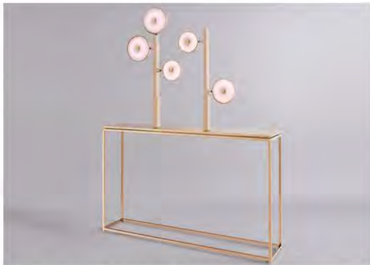
Studio MVW. Консоль JinShi Pink Jade. Медь, розовый нефрит, сталь, кожа, LED-подсветка. Тираж: 8 экземпляров + 4 прототипа.