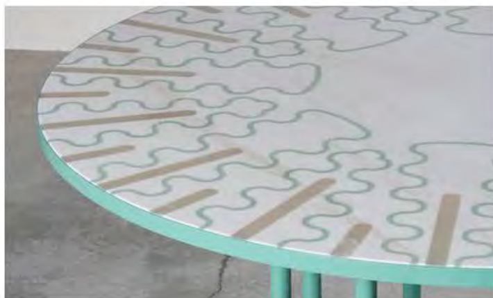
Бетан Лора Вуд. Обеденный стол Melon, 2017. Лимитированная серия.