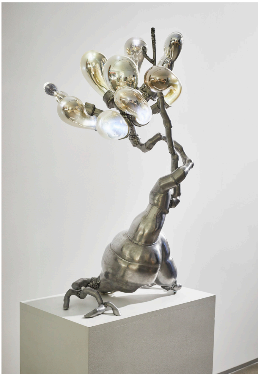
Sprout . Randy Polumbo. Cristina Grajales Gallery Como un bonsái distópico, este objeto biofílico imita el crecimiento de las plantas y se ha realizado con aluminio, vidrio soplado, acero y LED