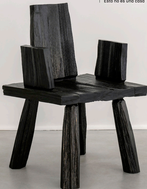
Urushi Split Armchair. Max Lamb. Gallery FUMI