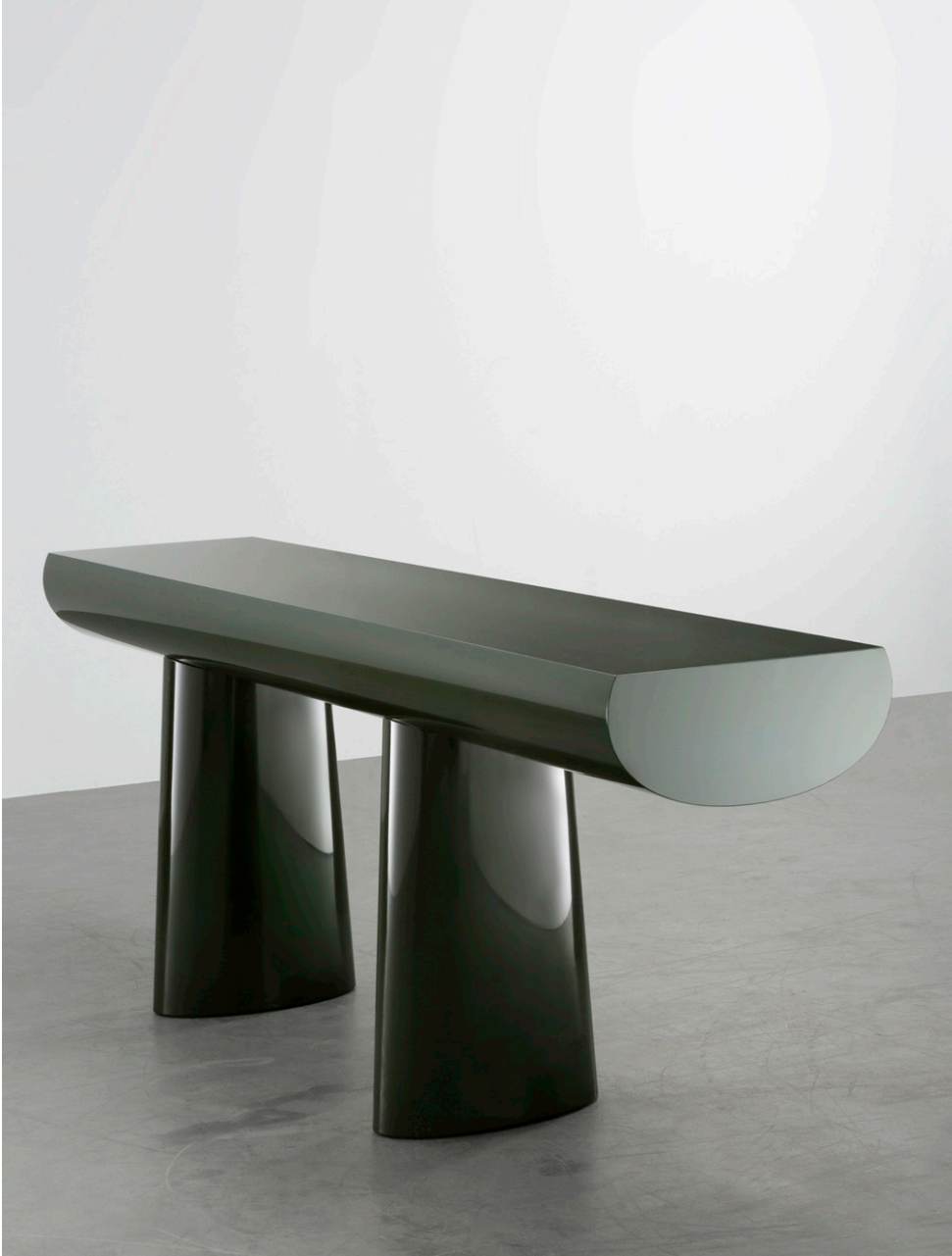
Green Table. Aldo Bakker. Carpenters Workshop Gallery

La mesa de Aldo Bakker ha sido producida con espuma pir y la técnica Urushi: procedimiento de laca milenaria que se cosecha en árboles nativos del este de Asia y cuyo acabado matérico no solo ofrece posibilidades estéticas, sino gran durabilidad.