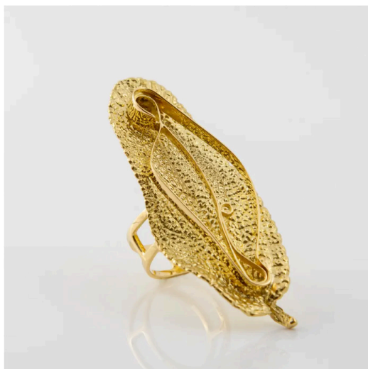
Giuseppe Penone, Salvia Ring. (7)

PAD London, du 10 au 16 octobre, Berkeley Square, Londres W1.