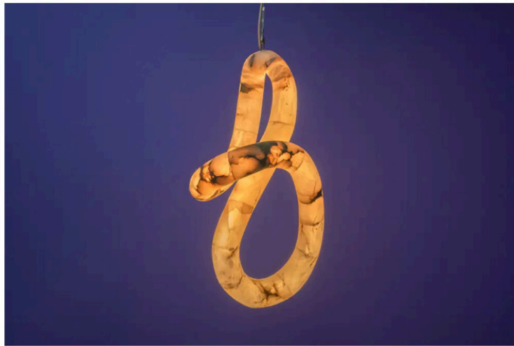
Amarist Studio, Aqua Fossil Chandelier. Courtesy of Priveekollektie