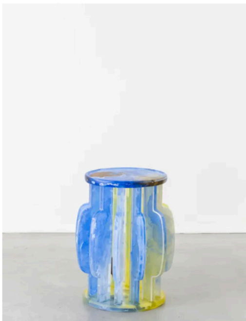
Jie Wu, Summer Solstice.

PAD London, du 10 au 16 octobre, Berkeley Square, Londres W1.