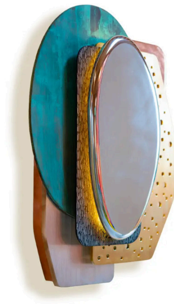
Joost van Bleiswijk, Sheets Collage Mirror Light (2020).