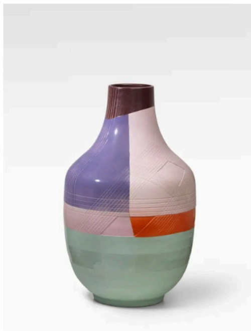
Hella Jongerius, Facet Bottle - Day.