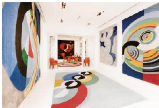
Galerie Hadjer, collection HADJER66.

« Frieze London & Frieze Masters », du 6 au 9 octobre 2016 à Regent's Park. www.frieze.com