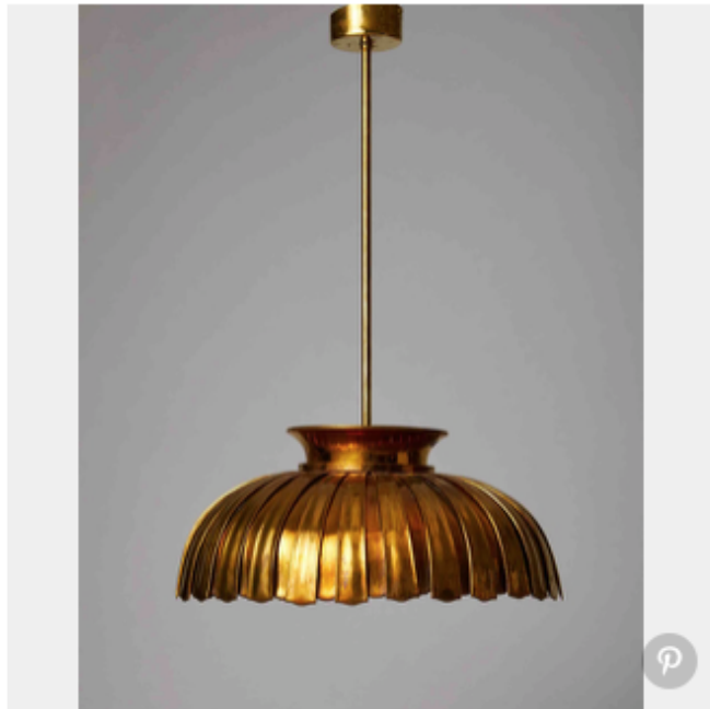
Gabriella Crespi, lampadaire Caleidoscopio , 1970 (Nilufar).